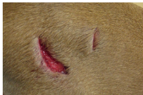
Bidsår før behandling.