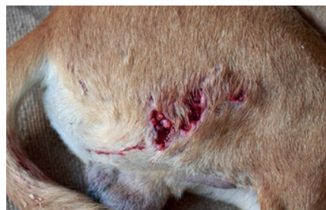
Frisk overfladisk bidsår.