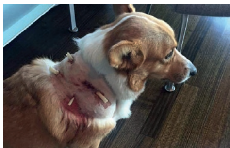
Bidsår og dræn.