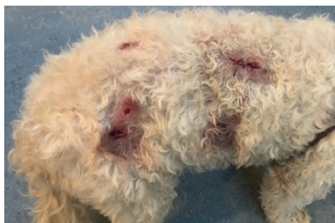
Hund med flere overfladiske bidsår.